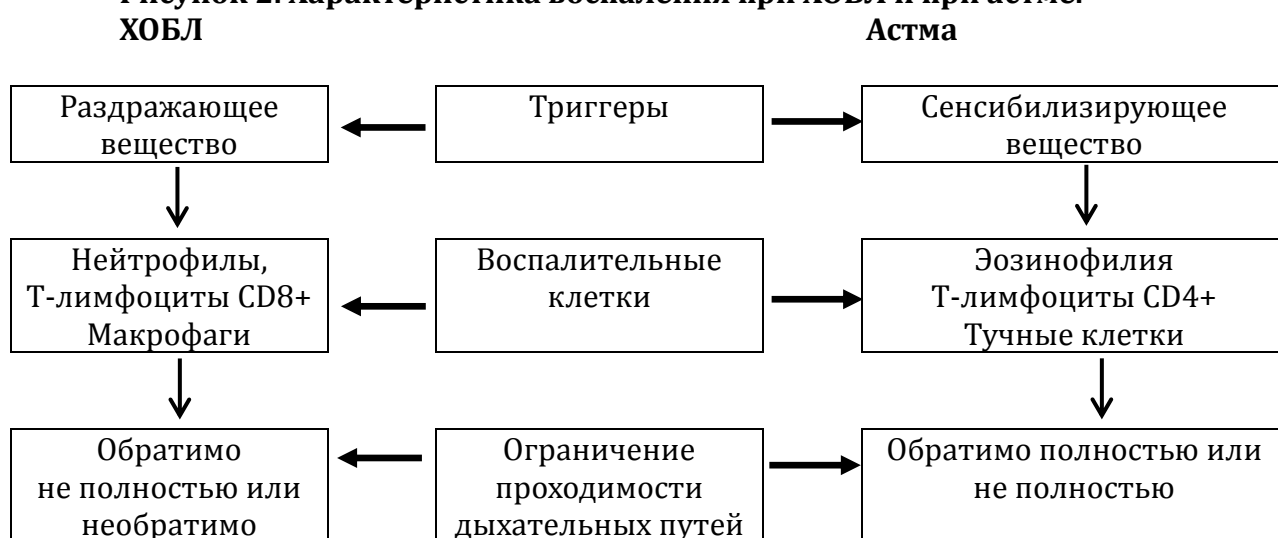
Рисунок 2. Характеристика воспаления при ХОБЛ и при астме.

Ведущие отправные пункты для дифференциальной диагностики этих болезней даны в табл. 6.