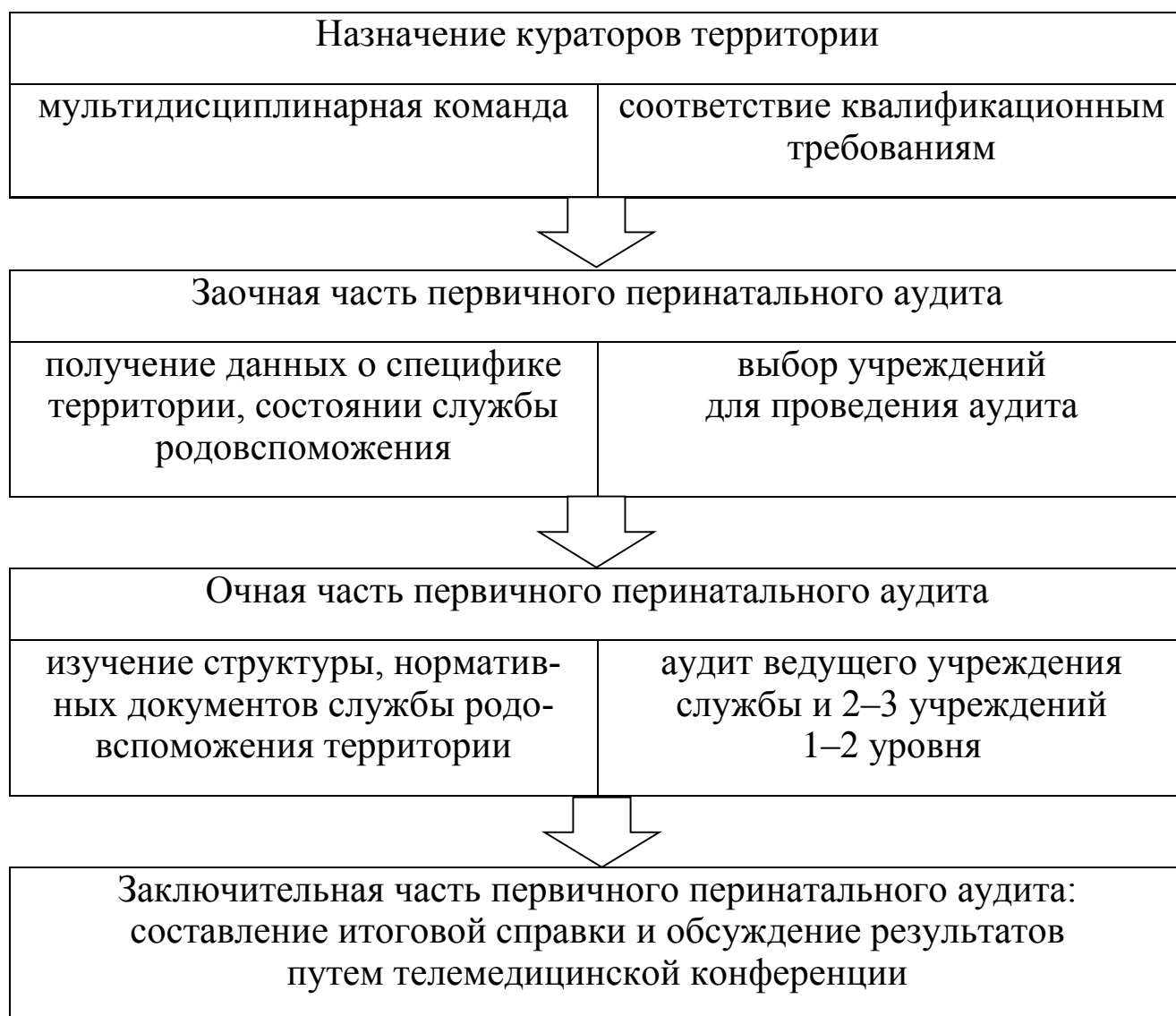
Рис. 2. Этапы первичного перинатального аудита

Динамика основных показателей работы службы родовспоможения и детства изучается на основе заполненной территориальными органами управления здравоохранения формы, содержащей данные годовых отчетов территории. Запрос посылается за 3–4 недели до проведения очной части аудита по электронной почте с соответствующими сопроводительными документами, отражающими цели, порядок проведения перинатального аудита.