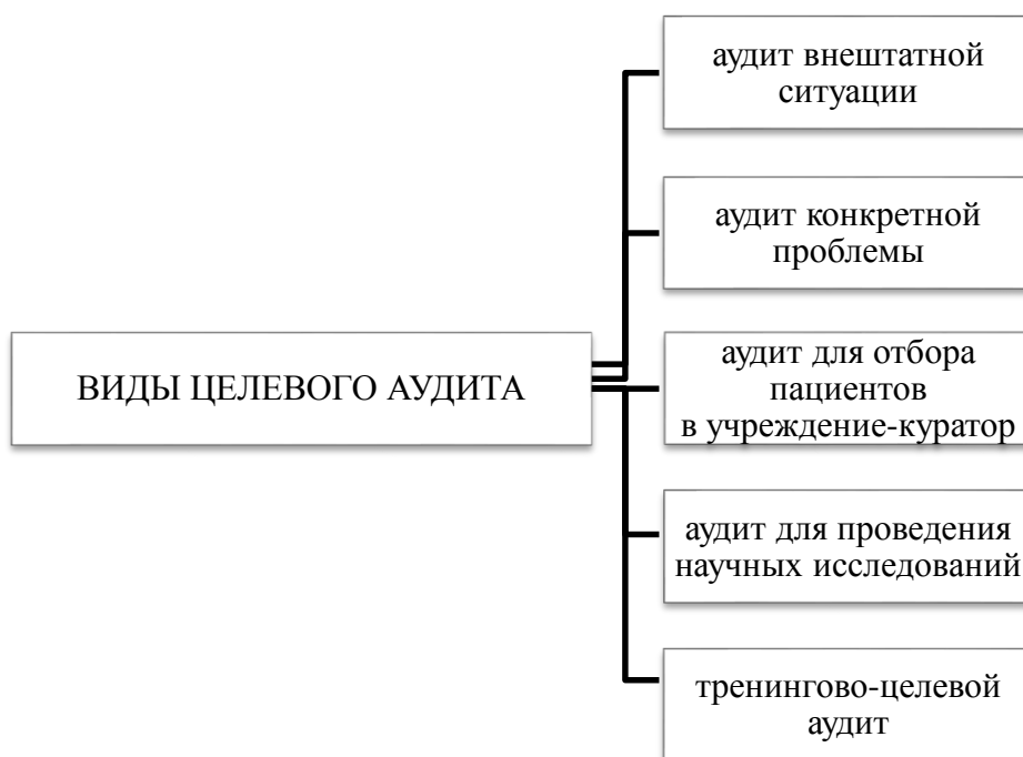
Рис. 3. Виды целевого аудита

Целевой перинатальный аудит проводится в определенных случаях (рис. 3).